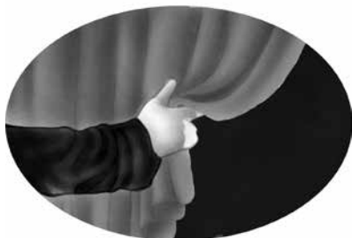
Figura 2: Apresentação teatral também é uma performance cultural.