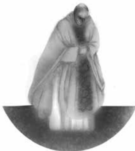
Figura 1: Rituais religiosos (a missa é uma performance cultural, porque através da linguagem falada e da encenação, a Igreja se expressa, se comunica com Deus e seus fiéis)

Segundo Turner (1987), a performance é uma forma de expressar e comunicar (linguagem falada e/ou por meio da dança, encenação, artes plásticas, canto) o conteúdo de uma determinada cultura. Alguns exemplos: