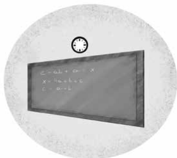
Figura 3: A aula que ministramos em sala pode ser compreendida como uma performance, pois utilizamos inúmeras formas de expressar, comunicar, para mediar o conhecimento.