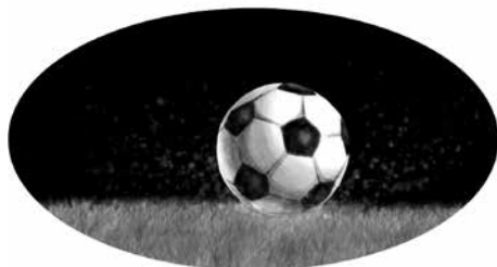
Figura 4: O futebol é uma ação performática, marcado por dribles, gols, aplausos, vaias. Um espetáculo em que o torcedor assiste, interage, se emociona.